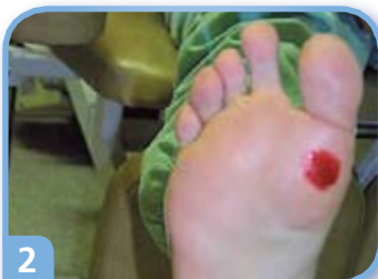
2 Merkitse alue esim. huulipunalla.