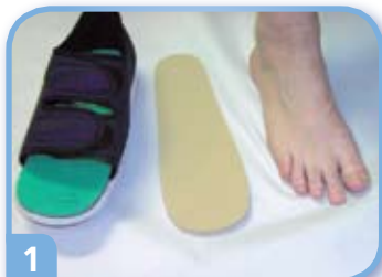
1 Poista pohjallinen kengästä.