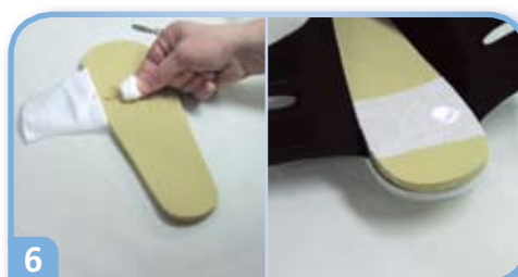
6 Peitä esim. kangaslaastarilla.