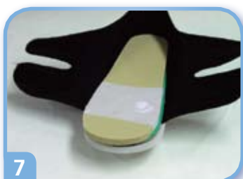
7 Laita pohjallinen kenkään.