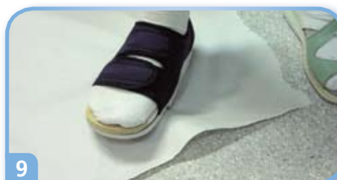
9 Pirka hoitokenkä valmiina käyttöön.

Hoitokengän tulisi olla jokaisessa hoitopaikassa potilaan saatavilla, kun painehaava on todettu. Oikeaoppisella kevennyshoidolla saadaan paras mahdollinen hoitotulos. Keventävällä tukipohjallisella vähennetään jalkapohjan kiputilaa tai ihovaurioon kohdistuvaa painetta.