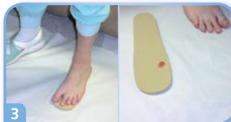
3 Merkitse / siirrä merkki pohjalliseen.