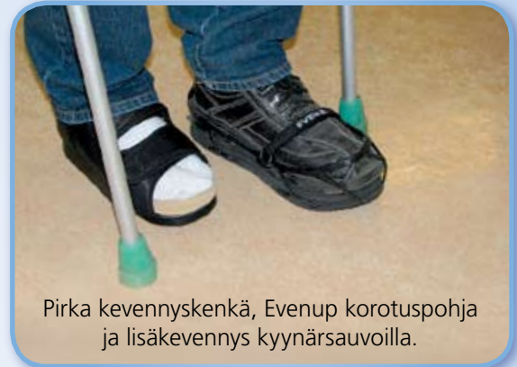
Pirka kevennyskenkä, Evenup korotuspohja ja lisäkevennys kyynärsauvoilla.

MATERIAALIT: Päällinen hengittävä, likaa hylkivä ja kulutusta kestävä puuvilla-polyester -kangas. Ulkopohja polyuretaani tai solukumi. Sisäpohja Luna-pohjallinen.